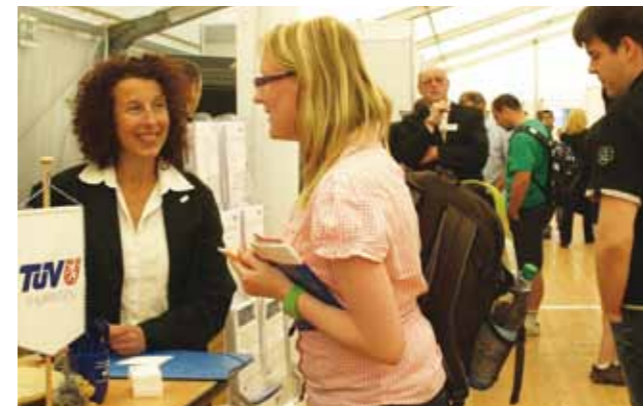
90 Unternehmen aus ganz Deutschland präsentieren sich im Mai für zwei Tage auf dem Campus der FH Schmalkalden, um zu zukünftigen Fach- und Führungskräften Kontakte zu knüpfen. Die Anfrage von Seiten der Unternehmen war in diesem Jahr so groß, dass das Messeteam sogar 20 Firmen aus Platzgründen absagen musste.