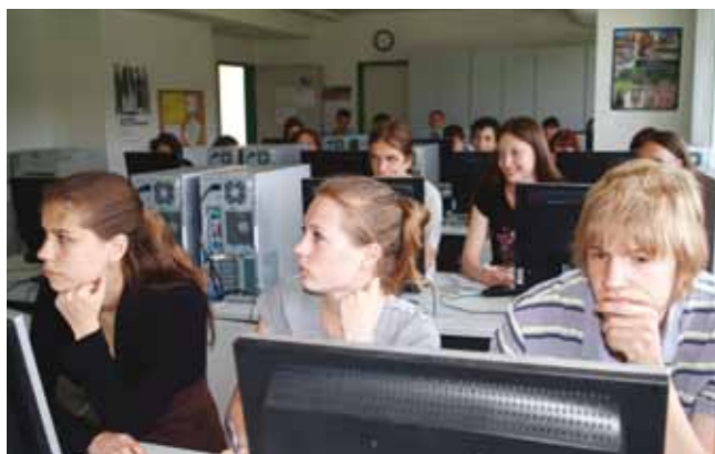
An der Fakultät Informatik weilten im Rahmen der 3. Summer School of Applied Computer Science 24 Studierende aus Sankt Petersburg, Moskau und Omsk. Sie belegten einen zweiwöchigen Kurs in russischer und englischer Sprache zu ERP-Systemen – einer komplexen Anwendungssoftware zur Unterstützung der Ressourcenplanung eines Unternehmens.