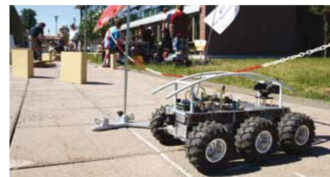
Einblicke in die Forschung zur Neuroinformatik, speziell in die Robotik mit einem Roboterparcours zeigte die Fakultät Elektrotechnik zu ihrem Sommerfest anlässlich des Jubiläums „20 Jahre Fakultät Elektrotechnik“.