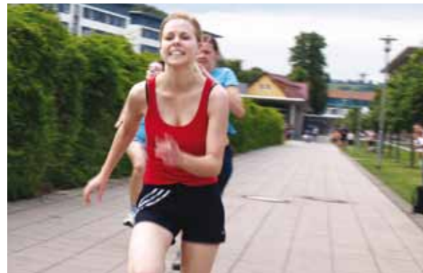
Auch bei den diesjährigen Schmalypics verwandelte sich die Hochschule zum Stadion: So absolvierten die Leichtathleten und -athletinnen ihre Wettkämpfe direkt auf dem Campus.