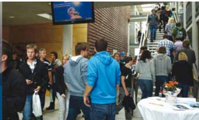
Viel los zum HIT - Zum Hochschulinformationstag informierten sich zahlreiche Studieninteressierte über die verschiedenen Bachelor- und Masterstudiengänge an der FH Schmalkalden.