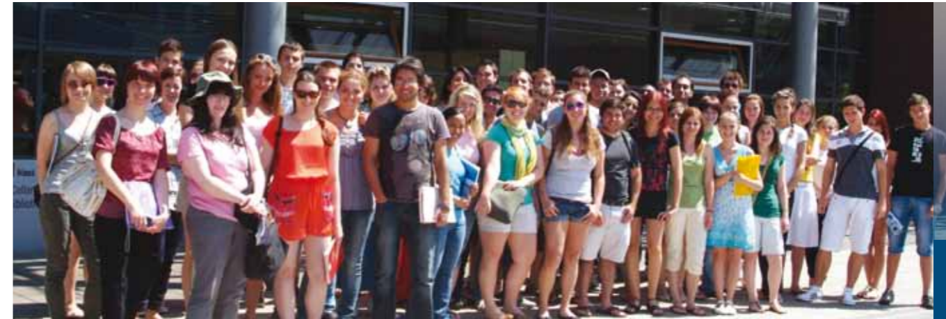
Die 50 Teilnehmerinnen und Teilnehmer des internationalen Deutschkurses kamen aus über zehn Ländern. Sie wurden unterrichtet von Gastdozenten aus den USA, Spanien, Rumänien, Russland und Ägypten. Der Sommer-Deutschkurs ist seit elf Jahren ein erfolgreicher Bestandteil der internationalen Beziehungen der FH Schmalkalden und Basis für zahlreiche Partnerschaften mit ausländischen Hochschulen.