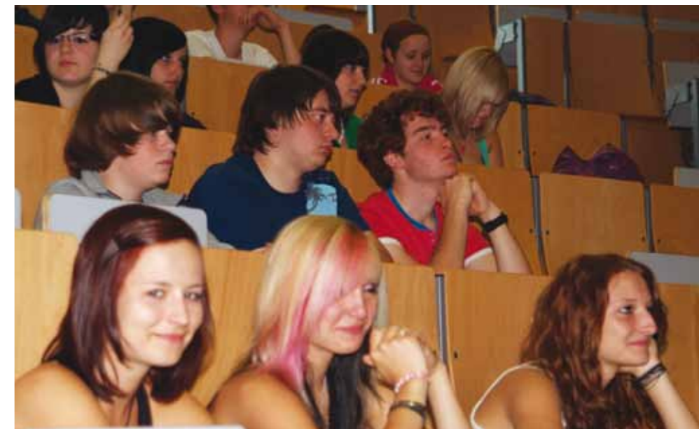
Mein Weg zum Studium - unter diesem Motto informierten sich 90 Schüler des Sulzberger-Gymnasiums aus Bad Salzungen an der FH Schmalkalden.

Like us on Facebook – die Studienberatung steht auch auf Facebook Rede und Antwort. Hier informiert das Team über Studienmöglichkeiten, Bewerbungs- und Zulassungsverfahren sowie über Aufbau und Anforderungen des Studiums. Zudem hilft die Studienberatung bei der Wahl des Studienganges und organisiert Führungen durch die Fachhochschule bzw. spezielle Einrichtungen für Schülergruppen.