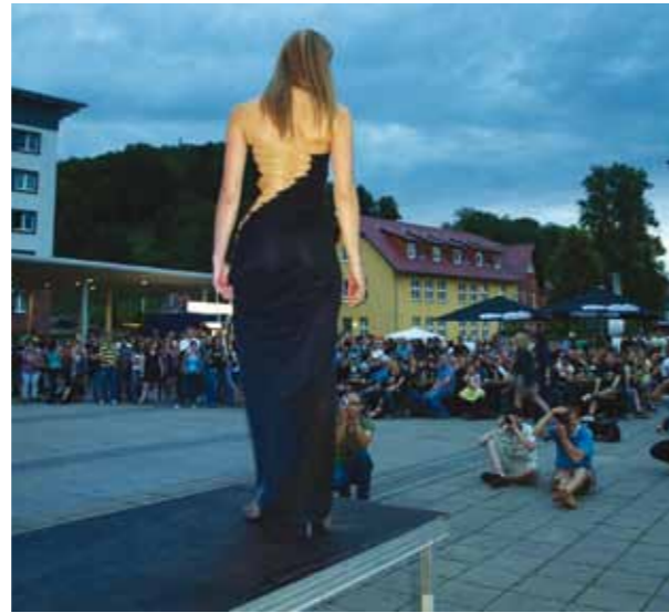
Der Höhepunkt im Sommersemester waren die VIII. Schmalypischen Spiele. Die Modenschau am zweiten Abend war ein echter Hingucker.