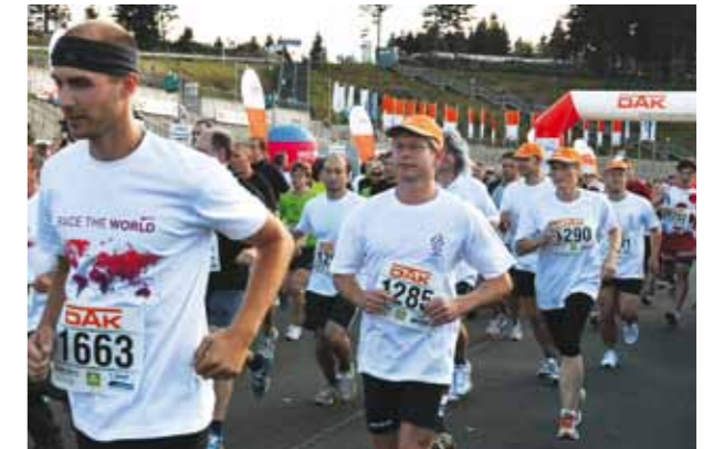
Das Team der FH Schmalkalden startete erfolgreich beim 2. DAK-Firmenlauf in Oberhof durch: Ideale Bedingungen lockten am 17. August rund 1.100 Läufer auf den 4,5 km langen Rundkurs in der Oberhofer Ski-Arena.